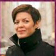
Helle Søholt Gehl Architects