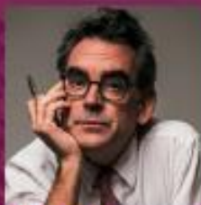
Mark Isitt Arkitekturskribent